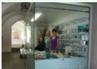
neue Kassabox im Stiftsmuseum

Im Rahmen der Sommerabende im STIFTSMUSEUM MILLSTATT ist das Stiftsmuseum im Monat August jeden Freitagabend bis 22 Uhr geöffnet mit Kerzen beleuchtetem Kreuzgang und stimmungsvoller Musik.